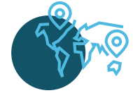
Uluslararası Teknoloji Firmaları